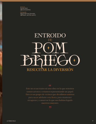
Ejemplo inicio de artículo.